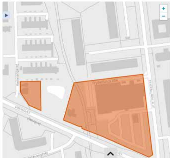
Screenshot af Lokalplansportalen d. 27.3.26 uden ny høringsfrist